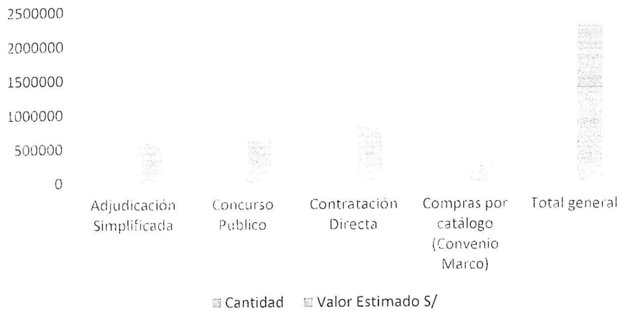
Cuadro N° 03

Cantidad y valor estimado en el PAC – 2019, Versión Inicial según tipo de procedimiento de selección: